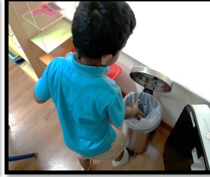
நடவடிக்கையைச் செய்த பின்னர், பிள்ளைகள் வகுப்பைச் சுத்தம் செய்தல்