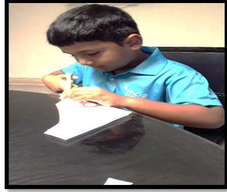
பிள்ளைகளுக்குப் பசை, கத்தரிக்கோல் போன்றவற்றைப் பயன்படுத்தப் கற்றுக்கொடுத்தல்