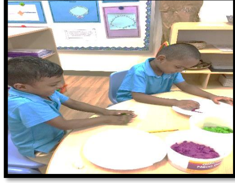
பிள்ளைகள் கைவினைப் பொருள் செய்ய களிமண்ணையும் வண்ணத்தாள்களையும் கொடுத்தல்